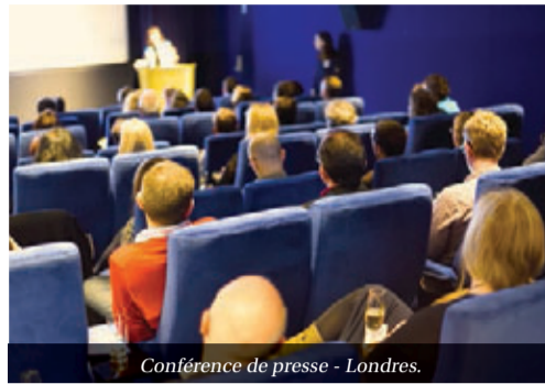
Conférence de presse - Londres.

D'ici la fin du mois de mars, un compte rendu qualitatif et quantitatif, tant du point des retombées médias que des avancées commerciales observées sera présenté et mis à la disposition de tous.