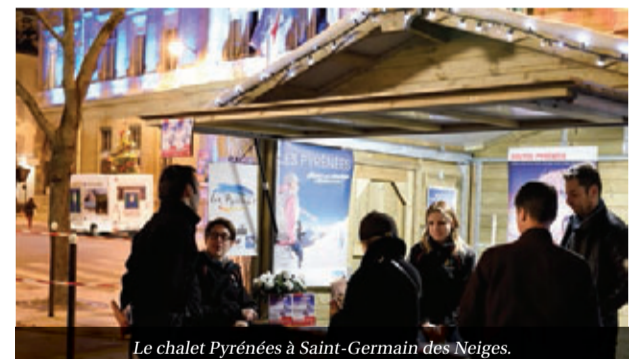
Le chalet Pyrénées à Saint-Germain des Neiges.

Pour l'édition 2015 de Saint-Germain des Neiges qui se déroulera du 22 au 25 novembre, la Confédération étudie avec France Montagnes la faisabilité d'une visibilité pyrénéenne plus forte au travers d'un espace d'animation dédié. Nous vous tiendrons informés.