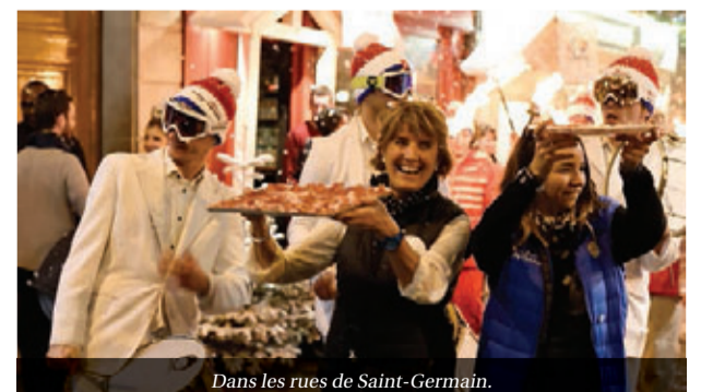
Dans les rues de Saint-Germain.