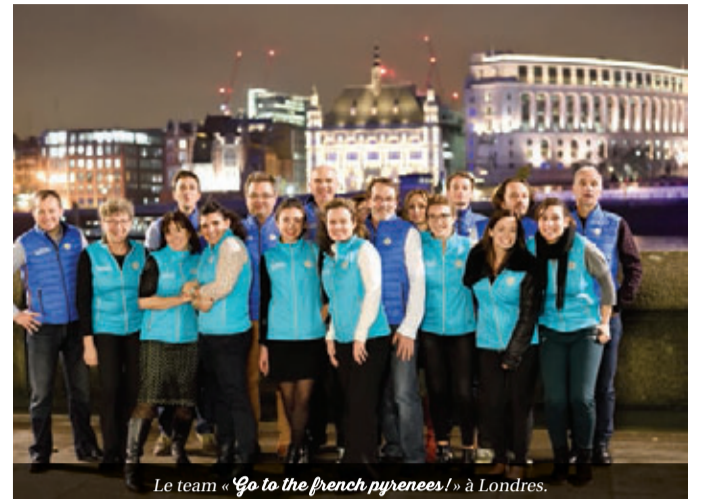
Le team « Go to the french pyrenees! » à Londres.